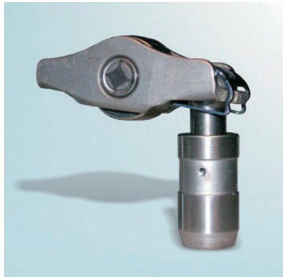
画像 1：仕様 1